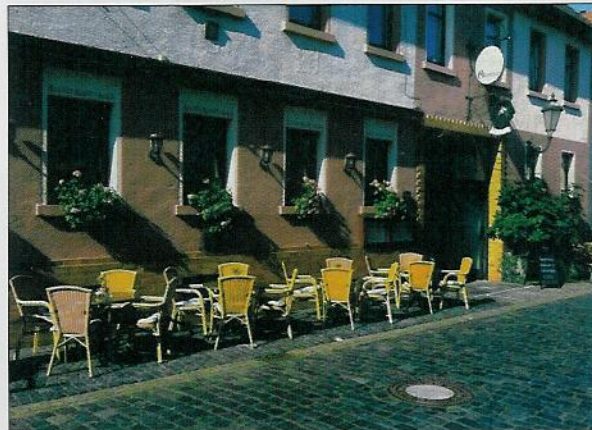
Inmitten der historischen Altstadt Steinheims können sich Gäste im gemütlichen Restaurant „Gambrinus“ verwöhnen lassen

Der frisch renovierte Gastraum des „Gambrinus“ strahlt Gemütlichkeit und Freundlichkeit aus. Für Festlichkeiten jeglicher Art eignet sich der Nebenraum mit etwa 60 Plätzen, wobei Essenswünsche, wie kalt-warme Büfets, Menüs oder a la